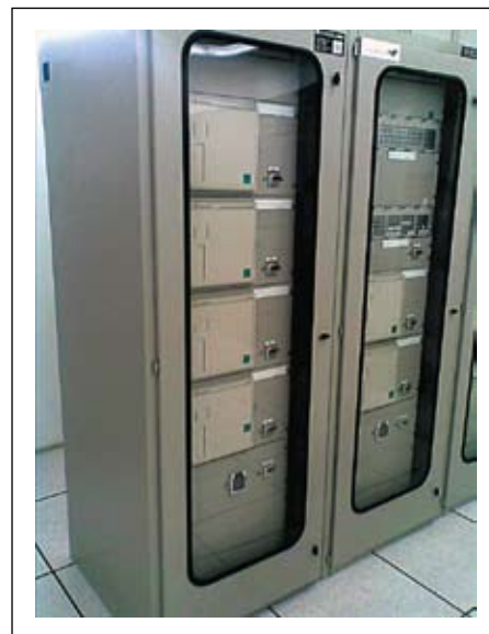
Рис. 2. Применяемый сегодня способ монтажа МУРЗ в шкафы