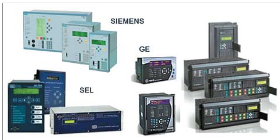
Рис. 1. Внешний вид современных МУРЗ различных производителей

дителю на период в 10–15 лет. Поскольку после совершения сделки для потребителя уже не имеет значения наличие нескольких производителей на рынке, так как он не может воспользоваться их изделиями. Выбраться из этой кабалы можно, только потратив еще раз не менее круглую сумму на приобретение комплекта МУРЗ другого производителя