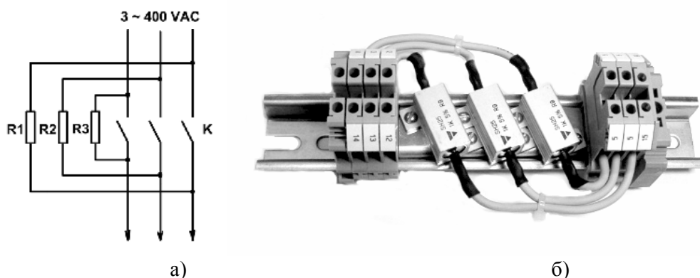
Рис. 1. Набор из трех резисторов, предназначенный для ограничения пускового тока (тока намагничивания силового трансформатора) и схема его включения. К – главный контактор

и выключенном контакторе внутренний силовой трансформатор обтекает небольшим током, ограниченным этими резисторами (0.1 – 0.2 А), достаточным для предварительного намагничивания трансформатора в течение времени задержки контактора. После срабатывания контактора, эти резисторы шунтируются его контактами и на работу устройства влияния не оказывают. Опыты на реальных устройствах показали, что эти резисторы могут иметь сопротивление 500 – 1000 Ом и мощность не более 25 – 50 Ватт.