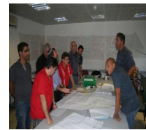
האגף עושה קייזן