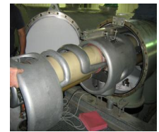
שיפוץ מפסיק זרם בפתח תקווה