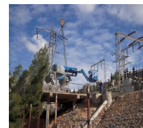
החלפת מבדדים בתחמ"ש י-ם ב'