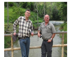
מה חדש בגינאה?