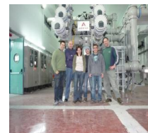
הכנסה לניצול תחמ"ש כפר סבא

התחיל לעבוד בחח"י בשנת 1995 דרך קבלן חיצוני ובשנת 1996 התקבל לחברה כעובד ארעי. בשנת 1997 הוא פוטר וחזר לעבוד בחח"י ב-2001 כעובד מן