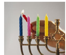
דבר מנהל האגף לשנת 2012